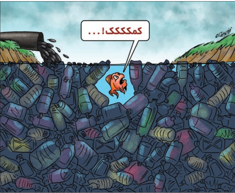
کار نویسست: جواد تگبو

رئیس سازمان محیط زیست: هیچ رودخانه ای در شمال کشور موجود زنده ندارد. پسماندهای زباله ها همه آن ها را از بین برده است.