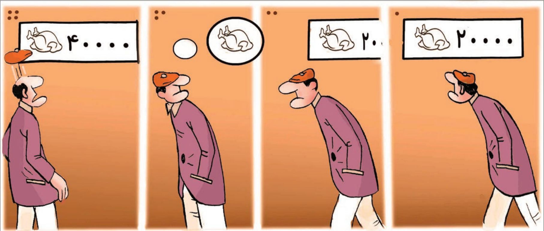
کار نویسست: حسین نقیب