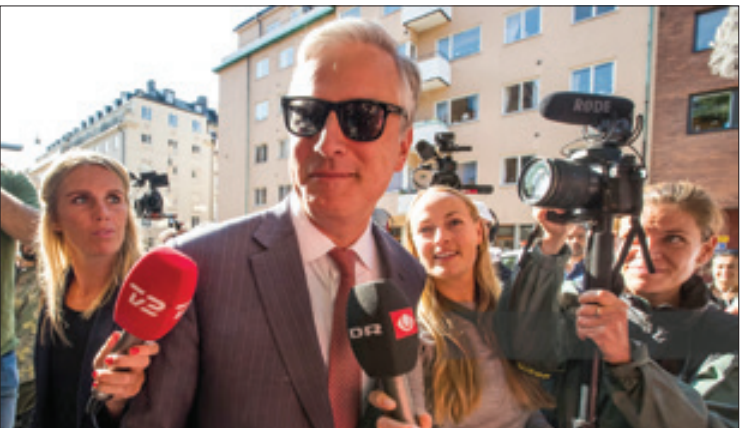
«گروگان آزادکن» مشاور امنیت ملی آمریکاشد

تنگانگی دارد و بر خلاف بولتون، به عنوان یک شخص قابل اعتماد باتصمیمات قابل پیش‌بینی شناخته می‌شود. او از طرفداران دونالد ترامپ و از حامیان او به شمار می‌آید. اردیبهشت ماه گذشته، رئیس‌جمهور آمریکا در واکنش به گزارش‌هایی درباره پرداخت پول به کره شمالی در ازای تحویل گرفتن یک گروگان، خودش را