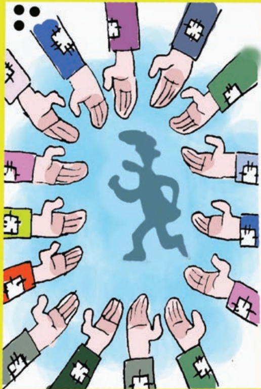
کار نویسست: حسین آقایی

دار کوب عزیز، در روز نامه جای عکست واقعا خالیه، چرا عکست رو چاپ نمی کنی تا چهره ما هت رو ببینیم؟! دار کوب: درسته که خیلی رک حرف می زنم ولی راستش یه خرده خجالتی ام! دار کوب: به وزیر بهداشت بگین اگه کلینیک ها رو جمع کنه خودش میاد خرج زندگی ما و امثال ما رو می ده؟ از طرف فرزندیک منشی که تا چند وقت دیگه مادرش بیکار می شه. دار کوب: من که خبری در این باره نخوندم ولی چشم، بهشون میگیم و مطمئنیم مسئولان ما با رعایت همه جوانب یه حرفی می زنن! دار کوب جان، مگه افراد دهک های بالا جزئی از این جامعه نیستن، پس چرا می خوان یارانه مون رو قطع کنن؟ دار کوب: والا این مبلغ یارانه الان به درد دهک های پایین هم نمی خوره، چه برسه به بالایی ها، واقعا لازمش دارین؟! دار کوب واقعا خسته شدیم از این همه گرونی های بی حساب و کتاب. دار کوب: تنها کاری که از ما بر میاد اینه که بگیم: خسته نباشین!