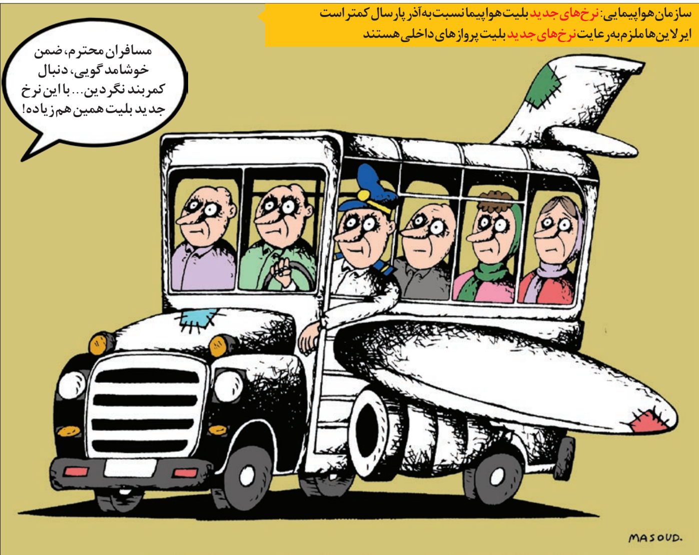
کار نویسست: مسعود ماسودی

سازمان هواپیمایی: نرخ های جدید بلیت هواپیما نسبت به آذر پار سال کمتر است ایرلاین ها ملزم به رعایت نرخ های جدید بلیت پرواز های داخلی هستند