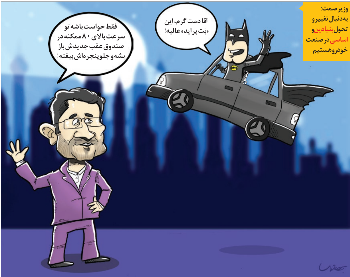
کار نویسست: محمد بهادری

فقط حواست باشه تو سرعت بالای ۸۰ ممکنه در صندوق عقب جدیدش باز بشه و جلو پنجره اش بیفته!