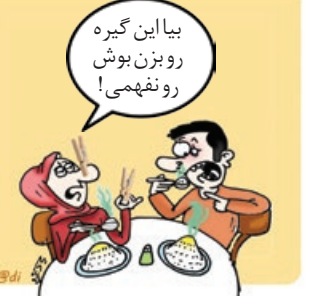
کار نویسست: هادی لکریان