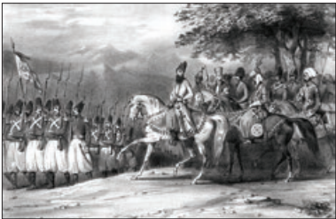
عباس میرزا و سوارهایش در نقشزار