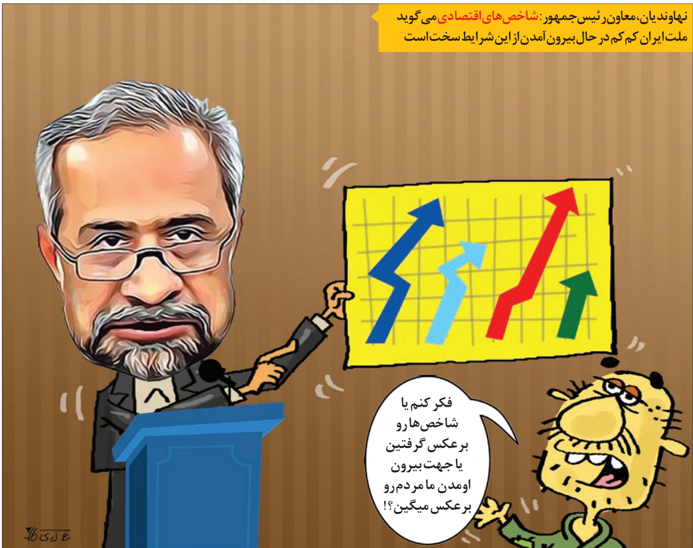
تصویر ساز: علی کاظمی

نهادن دین، معاون رئیس جمهور: شاخص های اقتصادی می گوید ملت ایران کم کم در حال بیرون آمدن از این شرایط سخت است