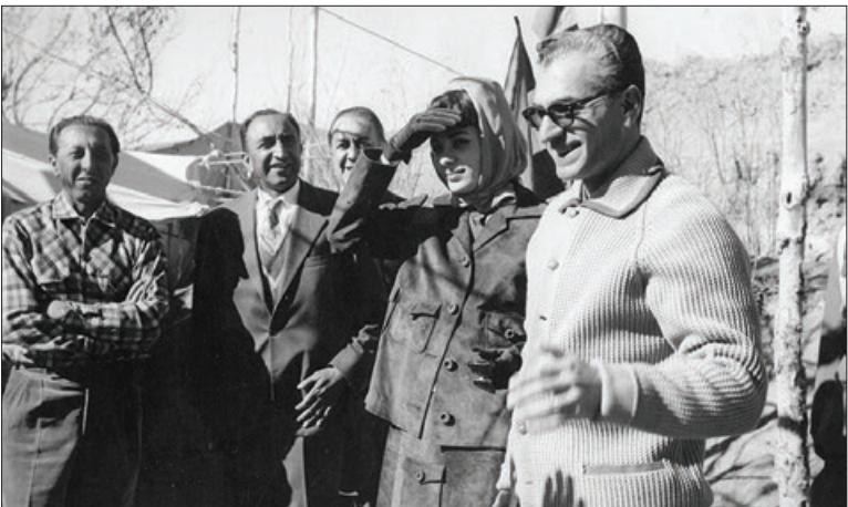
اسدا... علم (دوم از چپ) به همراه شاه و فرح؛ علم نقش مهمی در عیاشی‌های شاه ایفا می کرد

شوهرش را در حال معاشرت با دختران مختلف دید و دریافت که چراوی به او بی‌توجه است. در همین دوره بود که افشای رابطه پهلوی دوم با دختری که نام خانوادگی وی «دیوسالار» بود، فوزیه را به کلی از همسرش ناامید کرد. حسین فردوست در خاطراتش، به این رابطه و نقش «ارنست پرون» در افشای آن نزد فوزیه، اشاره کرده است. «پرون» حتی با کمک یک سرهنگ ارتش، فوزیه را در خانه دیوسالار برد و با شلیک گلوله به پنجره خانه، محمدرضا پهلوی را بیرون کشید تا دستش رو شود. این تنها موردی نبود که فوزیه به آن روبه‌رو شد.