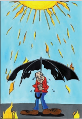
کار تونرست: خوراسانی

🔗 امروز قبض گاز اومده بود. مامان می‌گه چرا این قدر پول قبض گاز کم اومده؟ بابام میگه آخه این ماه کولر گازی کم روشن بود! 🔗 فکر نکنید دکترها به خاطر ندادن مالیات نمی‌خوان از کارت‌خوان استفاده کنن، فقط از این می‌ترسن یکی وسط معاینه بیمار در بزنه بیاد تو بگه داداش، به شارژ پنج تومنی برای من می‌کشی! 🔗 کجان اونایی که می‌گفتن گرمه وفلان؟ این غم‌موم شدن تابستون رو کی میخواد جواب گوباشه حالا؟! 🔗 امسال تابستون با نسل جدید پشه‌ها آشنا شد، از لحاظ قدرت مانور در هوا. جالب این که رادار گریز هم هستن و دیده نمی‌شن، فقط بپهو می‌بینی یه جایی داره می‌سوزه!