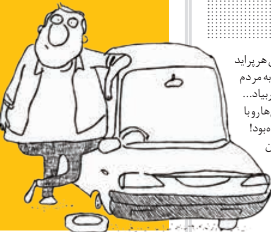
کارتون: سید جواد نکونام