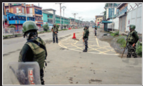
جالش های بسیار ساکنان کشمیر در پی محدودیت های اعمال شده از سوی هند

شهید فرمانده حاج عماد (مغنیه) به صورت مستقیم با مادر تماس بود، هنگام غروب دستور شلیک صادر شد. به محض صادر شدن دستور شلیک، برادران مادستور را اجرا کردند و تعداد مد نظر موشک ها به تال آویو بد نیست تا بداند ساعر اگر به خلیج فارس بیاید پاسخ بیشتر از یک موشک سطح به دریا و کروز ضد کشتی خواهد بود.