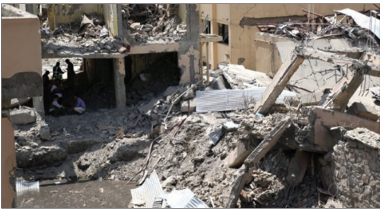
۶ دی‌الحجه ۱۴۴۰،شماره ۲۰۱۶۷