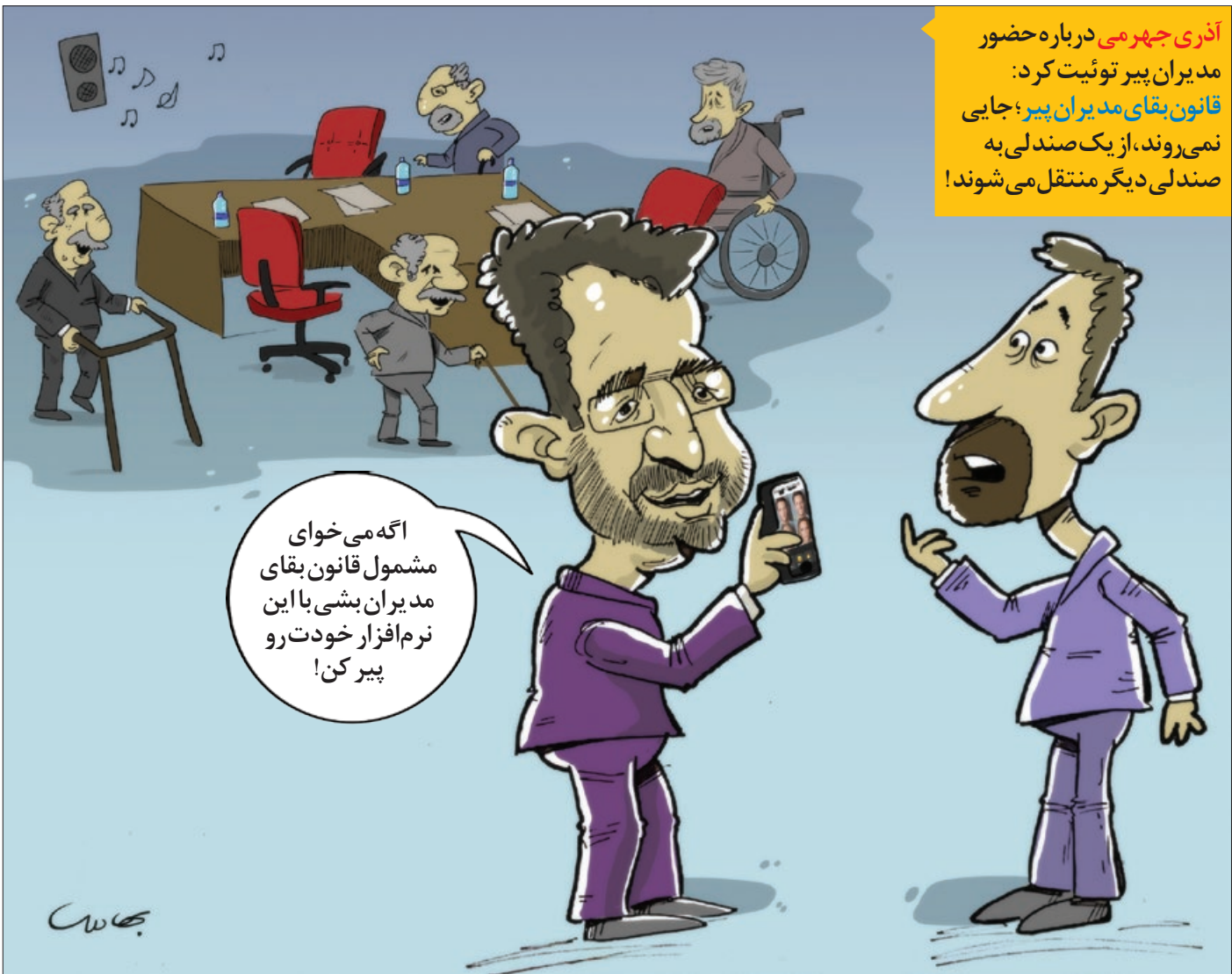
کار توثیت: محمد پناه داری

آذری جهرمی درباره حضور مدیران پیر توثیت کرد: قانون بقای مدیران پیر؛ جایی نمی روند، از یک صندلی به صندلی دیگر منتقل می شوند!