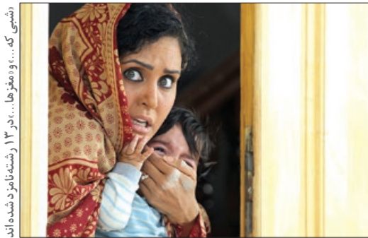
«شبی که...» و «مغزها...» در ۱۳ رتبه‌نازده شده‌اند

روبیکیو شرکت‌کنند؟ وسوسه دریافت همین جایزه است که شرکت‌کننده را پای تلویزیون و اپلیکیشن روبیکا می‌کشاند. آن چیزی که در دستور صریح رهبر انقلاب، مبنی بر ترویج نکردن «روحیه انتظار برای ثروت بادآورده» آمده است، دقیقاً همین اتفاقی است که در مسابقه روبیکیو می‌افتد. مدیران شبکه یک، باید به این پرسش پاسخ دهند که با چه مجوزی، این مسابقه را به آنتن برگردانده‌اند.