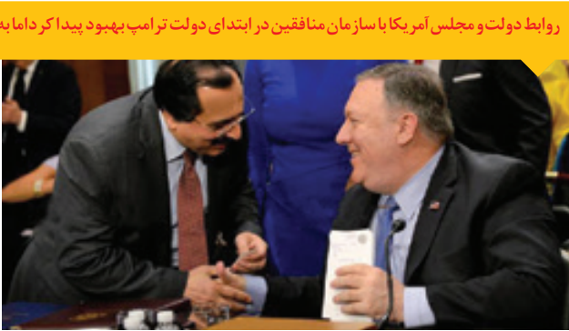
دیدار اعضای منافقین با وزیر خارجه آمریکا