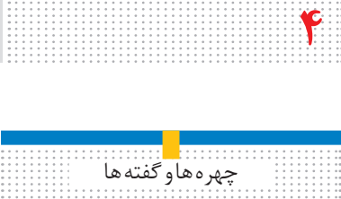
چهره‌ها و گفته‌ها