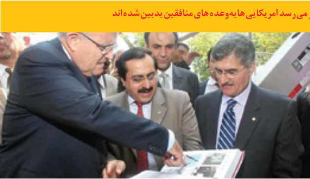
بازدید نوروزی وکیل ترامپ از دفتر آمریکایی منافقین و دیدار با جعفرزاده صفوی

اشراف ۳ آخرین محل اسکان منافقین در آلبانی این اردوگاه ظرف ۱۸ ماه آینده به عرستان آمریکا و اسرائیل ساخته شده و دارای ۱۹ سوله بزرگ در ۳۴ هکتار می‌زبان ۱۳۰۰ تروریست عضو سازمان منافقین است که شبانه‌روز مشغول سم‌پاشی علیه جمهوری اسلامی هستند.