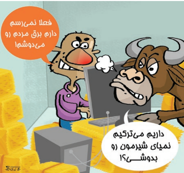
کار نویسندگی کاوشی

سود ۱۰۸ میلیون تومانی هر واحد بیت کوین در ایران باعث شده گاوداری ها هم به استخراج بیت کوین بپردازند!