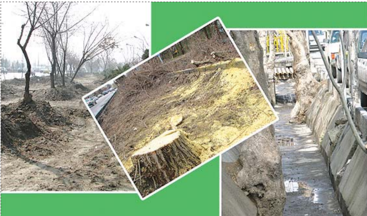
توسعه شهری بدون توجه به اهمیت درختان همچنان در گوشه و کنار مشهد رخ می دهد.

وی با اشاره به این که برای هر درختی که روتبال می شود، ۲۵ هزار تومان هزینه می پردازیم، افزود: امسال بیش از ۱۰ هزار درخت را در مشهد روت بال کردیم. وی همچنین گفت: اگر در مشهد فضای سبز خوبی داشته باشیم اختلافات زناشویی، مراجعه به پزشک و دادگستری کاهش می یابد، سطح کارایی و اثر بخشی مراکز علمی دانشگاهی ارتقا پیدا می کند، مردم در مساجد بهتر عبادت می کنند و آرامش به سراغ مردم می آید.